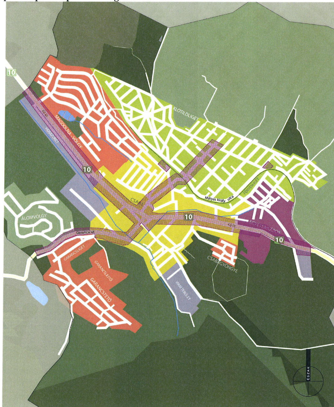
Településképi szempontból meghatározó területek